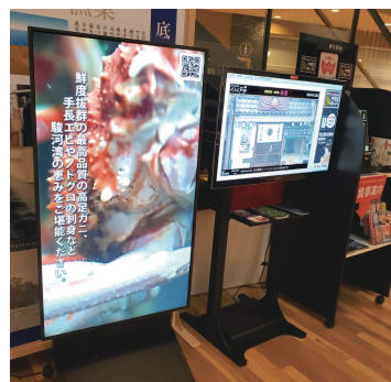
くら戸田のデジタル看板