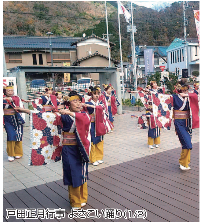
戸田正月行事 よさこい踊り(1/2)