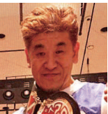
所属する沼津石川ボクシングジムでは現在会員募集中です。