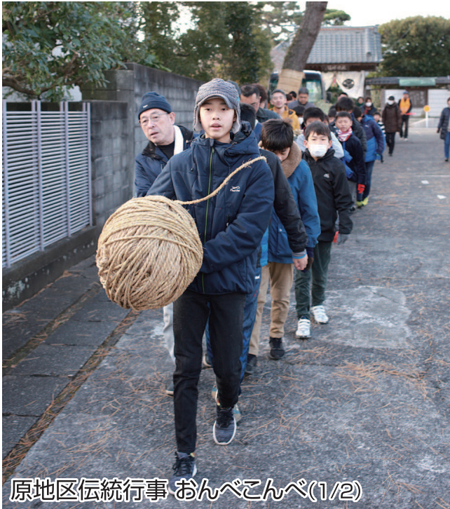
原地区伝統行事 おんべこんべ(1/2)

No. 109 発行者 沼津市商工会 会長 渡邊好孝 〈本所・原支所〉沼津市原1200番地の1 TEL(055)966-1331 FAX (055)967-4925 〈戸田支所〉沼津市戸田1028番地の5 TEL(0558)94-2224 FAX (0558)94-4029 編集 沼津市商工会広報委員会