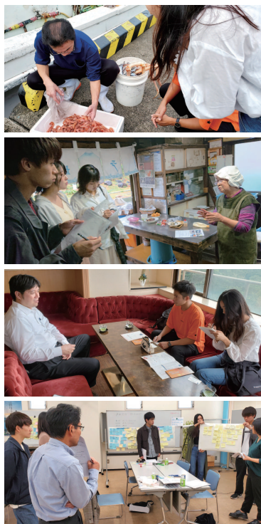
▶フィールドワーク及びとりまとめ作業の様子

に分かれて地区内の逸品申請事業所の調査を実施し、その後「戸田地区の逸品の評価・戸田の観光振興プラン」をテーマにとりまとめ作業を実施しました。